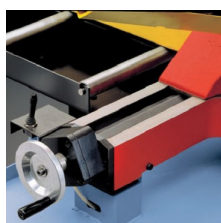
» Mordaza neumática