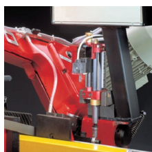
» Ski stop