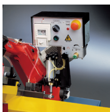
» Bajada controlada