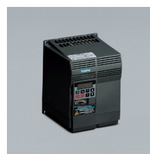
» Variador electrónico