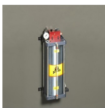
» Dispositivo de corte en seco